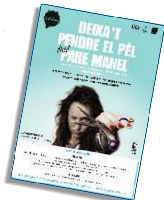
Cartell dissenyat per Sandwich

"La Pelu" i "l'Art de Saber Comunicar" s'uneixen en aquesta jornada lúdica i festiva: una perruqueria a l'aire lliure amb actuacions musicals. Sota de l'escenari central de la Festa de la Mercè 2012 a la plaça de Catalunya, perruqueres i perruquers tallaren el cabell o pentinaren a tothom que col·laborà amb la campanya.